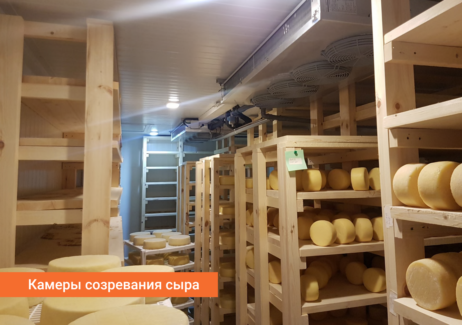
Камеры созревания сыра