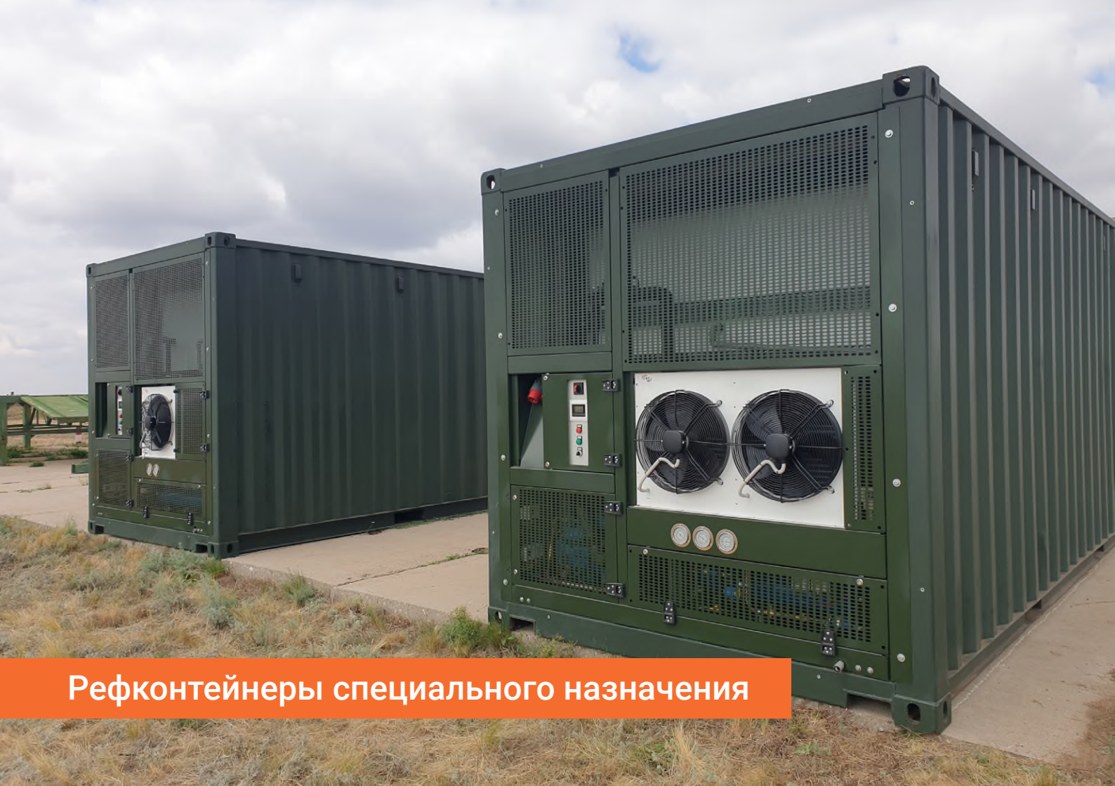
Рефконтейнеры специального назначения