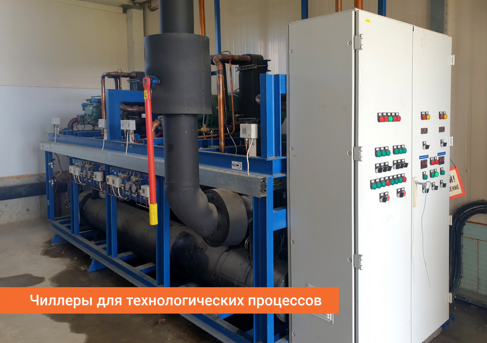
Чиллеры для технологических процессов