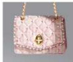
AUTUMN LOOK 雅致春装, 韵味悠长