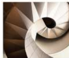
THE NEW CLASSICS 经典之美, 缔造永恒